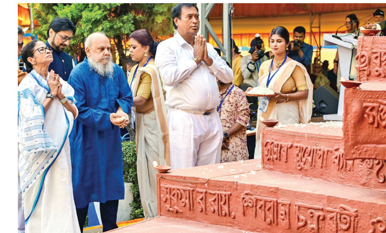
भाजपा के राज्यसभा सदस्य नागेंद्र राय को बंग विभूषण से सम्मानित करने वाले कार्यक्रम में मुख्यमंत्री ममता बनर्जी

एक माकपा कार्यकर्ता ने कहा, ‘शहरी इलाकों के अमीर भाजपा समर्थकों को चुनाव के दिनों में पोलिंग बूथ पर ड्यूटी करने की मेहनत करना पसंद नहीं आता।’ ग्रामीण बंगाल में, आरएसएस कार्यकर्ता इस तरह की किसी भी कमी को