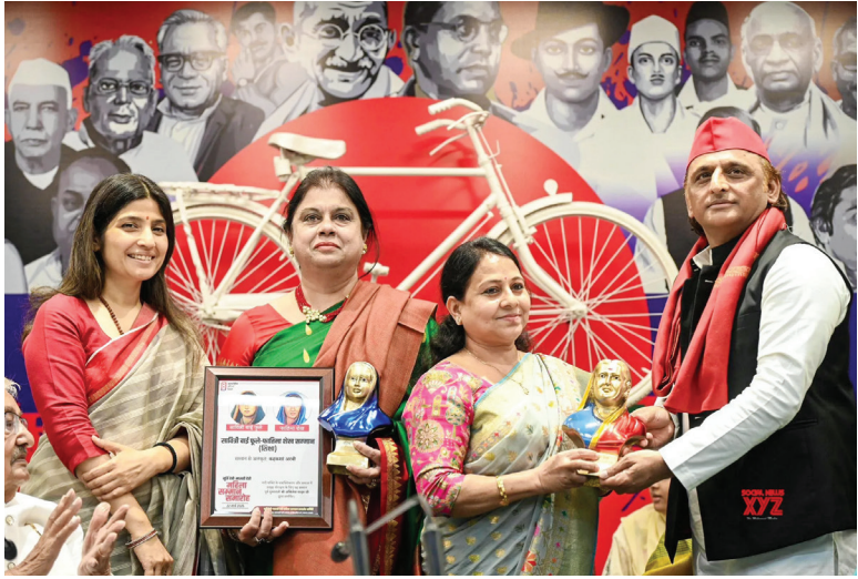
अखिलेश यादव जानते हैं कि महिला वोट कितने निर्णायक हैं, इसीलिए उन्होंने महिला वर्ग के बीच इन्फ्लुएंसर/लीडर स्थापित करना शुरू किया है

29 मार्च को गौतमबुद्धनगर के दादरी में हुई समाजवादी समानता भाईचारा रैली से यूपी चुनाव अभियान की शुरुआत करते हुए भी अखिलेश ने कहा कि 'पीड़ा ही वह धागा है, जो पीडीए के लोगों को एक सूत्र में बांधता है। एक तरफ अहंकारी लोग हैं, जो उपेक्षा और उत्पीड़न करते हैं और दूसरी ओर उत्पीड़ित और उपेक्षित लोग हैं। ऐसे कमजोर और गरीब लोग हर जात-धर्म में होते हैं। जिसने अत्याचार, भेदभाव और उत्पीड़न की पीड़ा नहीं झेली है, वे हमदर्दी तो दिखा सकते हैं लेकिन उस दर्द को महसूस नहीं कर सकते, जो हमारे घर को गंगाजल से धुलवाने पर हमको हुआ था, या मंदिर धुलवाने पर जो हमने महसूस किया था।' ध्यान रहे कि 2017 विधानसभा चुनावों में सपा की हार के बाद मुख्यमंत्री आवास में योगी आदित्यनाथ के प्रवेश से पहले