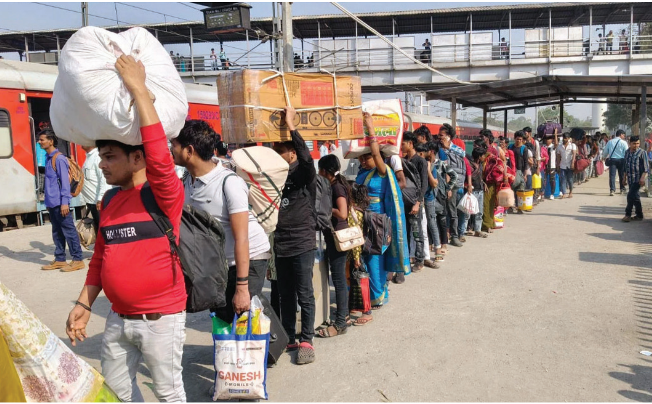
पश्चिम एशिया के युद्ध ने प्रवासी मजदूरों को अपने गृह-राज्य लौटने को मजबूर कर दिया है

सूक्ष्म, लघु और मध्यम उद्यम केन्द्र सरकार से खैरात नहीं मांग रहे, वे तो बस जिंदा रहने की व्यवस्था चाहते हैं