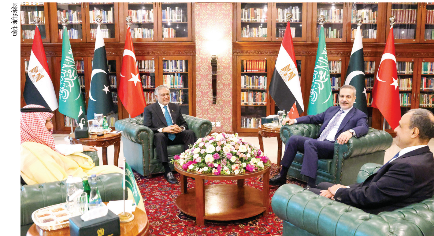
अमेरिका-इसराइल-ईरान युद्ध खत्म कराने के रास्ते तलाशने की कोशिश में सऊदी अरब, पाकिस्तान, तुर्की और मिश्र के विदेश मंत्री

2020 की गलवान झड़प के बाद, मोदी सरकार ने चीनी ऐप्स और टेलीकॉम कंपनियों पर बैन लगा दिया था, लेकिन जब आर्थिक दबाव बढ़ा, तो उसने चुपचाप उनमें से कई बैन हटा लिए। उसने चीन के बढ़ते प्रभाव का मुकाबला करने के लिए एक रणनीतिक कदम के तौर पर ‘क्वाड’ समूह (जिसमें अमेरिका, भारत, जापान और ऑस्ट्रेलिया