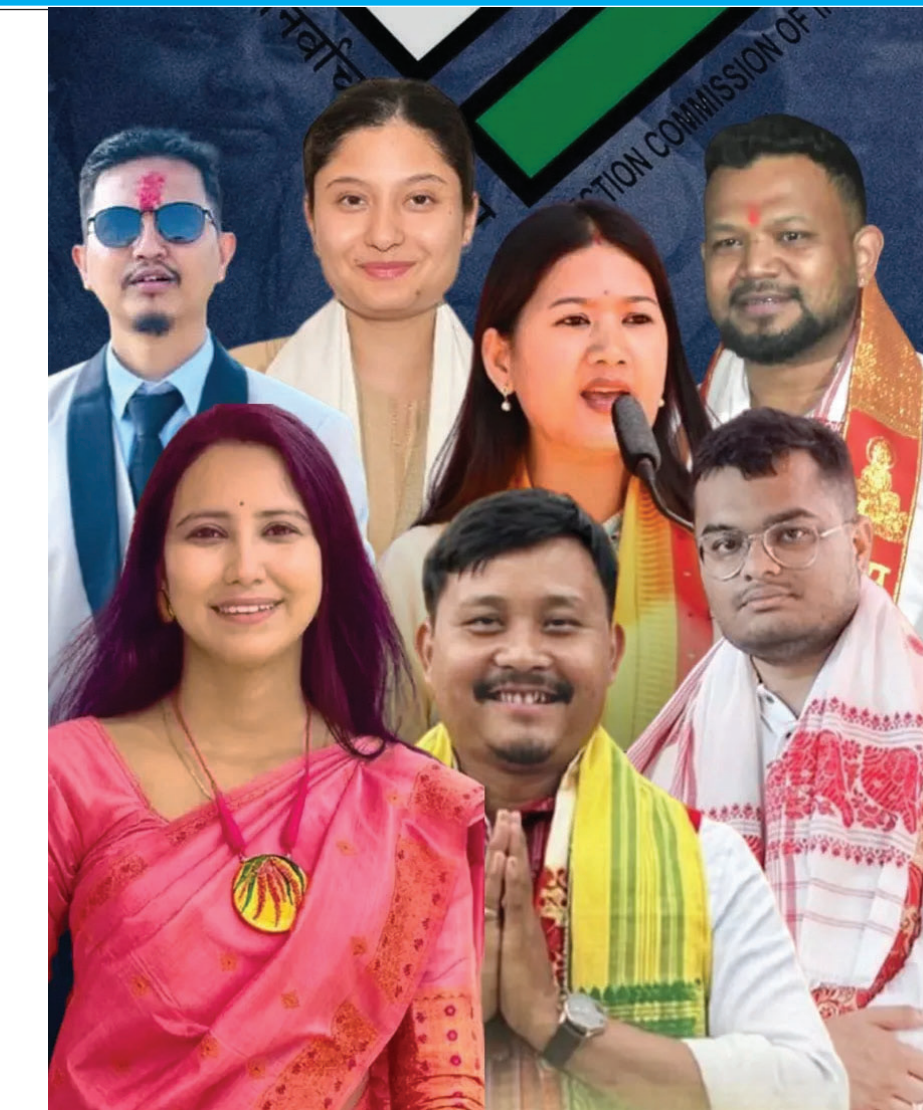
युवाओं की सक्रिय भागीदारी बता रही है असम में बदलाव की प्रबल इच्छा की कहानी