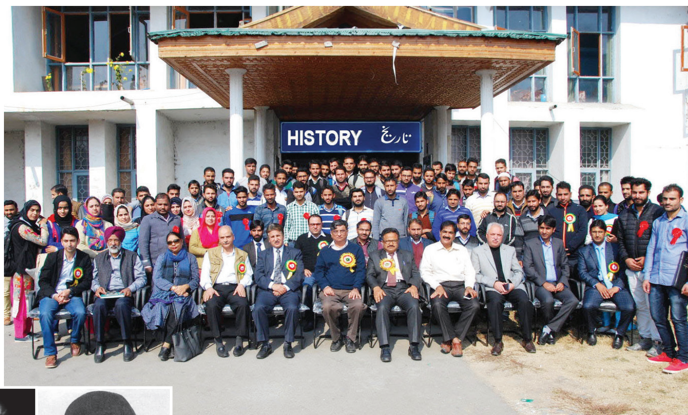
जम्मू यूनिवर्सिटी का इतिहास विभाग। (नीचे बाएं से) मोहम्मद अली जिन्ना, मोहम्मद इकबाल और सैयद अहमद खान