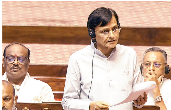
संसद में एफसीआरए संशोधन विधेयक पेश करते केन्द्रीय गृह राज्य मंत्री नित्यानंद राय। (नीचे) केरला का मल्लाकारा चर्च

विदेशी अंशदान (विनियमन) संशोधन विधेयक रेगुलेटरी नियमों के पालन को एक ‘डेमोकलीज की तलवार’ जैसा खतरा बना देता है, जहां प्रक्रिया में होने वाली देरी या चूक के कारण संपत्ति हमेशा के लिए जब्त की जा सकती है