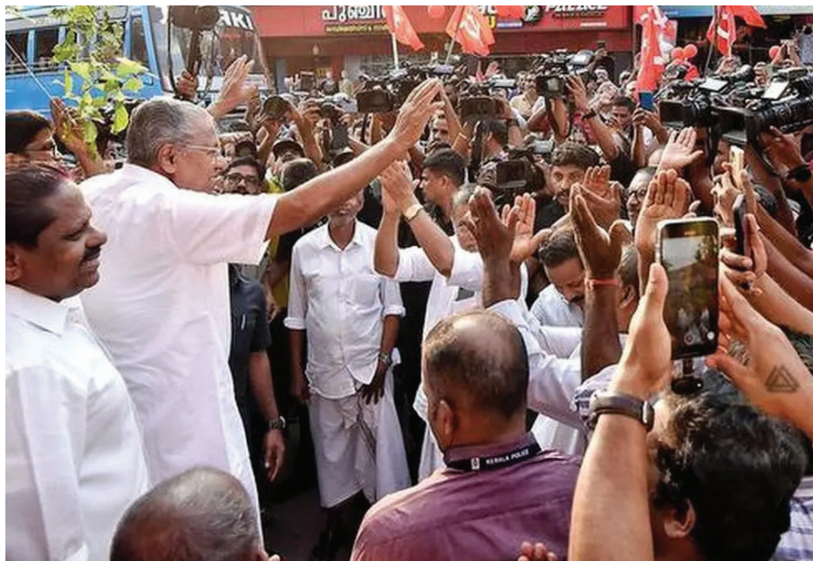
खोखली होती लोकतांत्रिक और वैचारिक बुनियाद पिनाराई विजयन के लिए बनी बड़ी चुनौती

राज्य की सत्ता में पिनाराई विजयन के इस एक दशक ने निस्संदेह केरला का कायाकल्प किया, लेकिन इस सफलता की कीमत को लेकर कुछ बुनियादी सवाल भी खड़े कर दिए हैं। और इस तरह, यह कहानी घूम-फिरकर वापस पिनाराई पर आ उठर जाती है। परंपुरम पर। सादगी भरे उन ठािकानों पर, जहां कभी केरल का कम्युनिस्ट आंदोलन बड़े शांत माहौल में संवाद और सामूहिक कल्पनाशीलता के जरिये आकार लेता था। ■