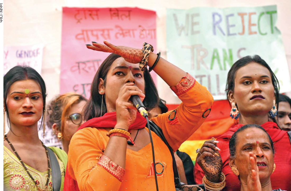
ट्रांसजेंडर संशोधन विधेयक का विरोध करते एलजीबीटी समुदाय के लोग

उम्मीद है कि आदिवासी गांवों में ‘स्वबोध’ की भावना जगाने से, ‘युवाश्री’ और ‘लक्ष्मी भंडार’ जैसी सरकारी कल्याणकारी योजनाओं पर उनकी निर्भरता कम होगी।