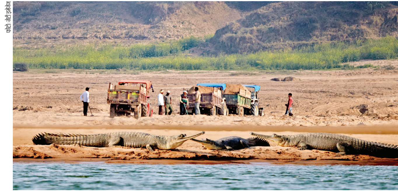
चंबल घाटी मेंकिया जा रहा अवैध खनन अपने आप में गवाही देता है कि घड़ियाल किस प्रकार गंभीर संकट में हैं