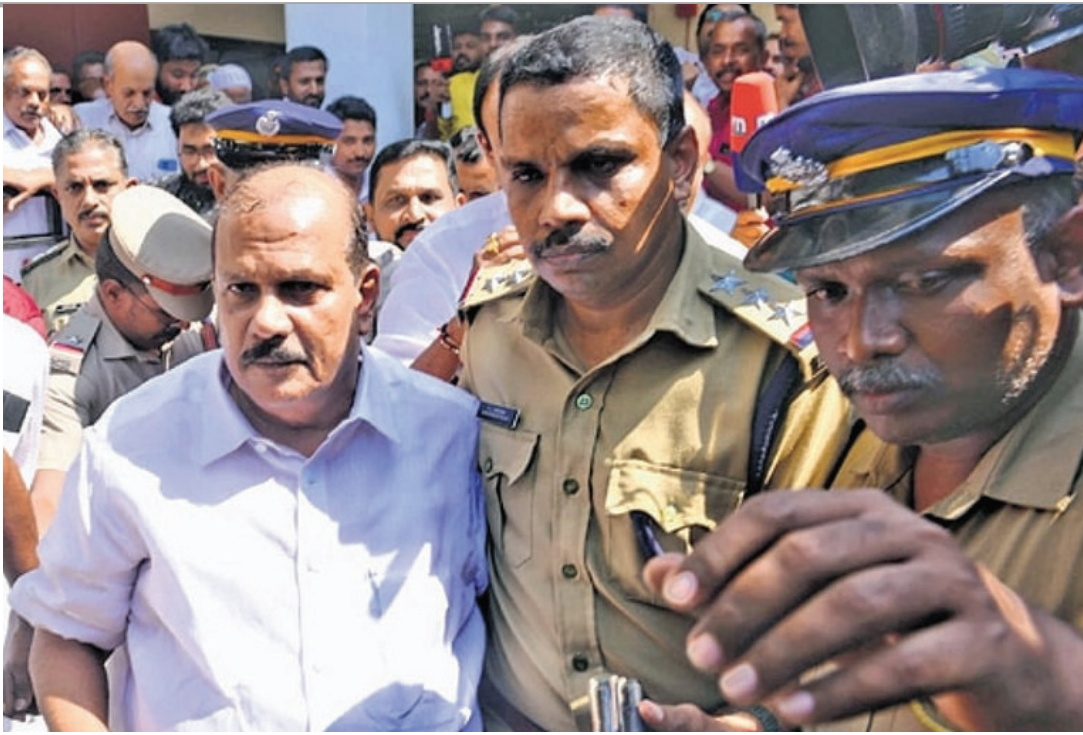
भाजपा नेता पी.सी. जॉर्ज जिनके बयान पर उठ रहे सवाल

खुद भाजपा के भीतर भी इस बात को माना जाने लगा कि उन्होंने सही समय और गति -