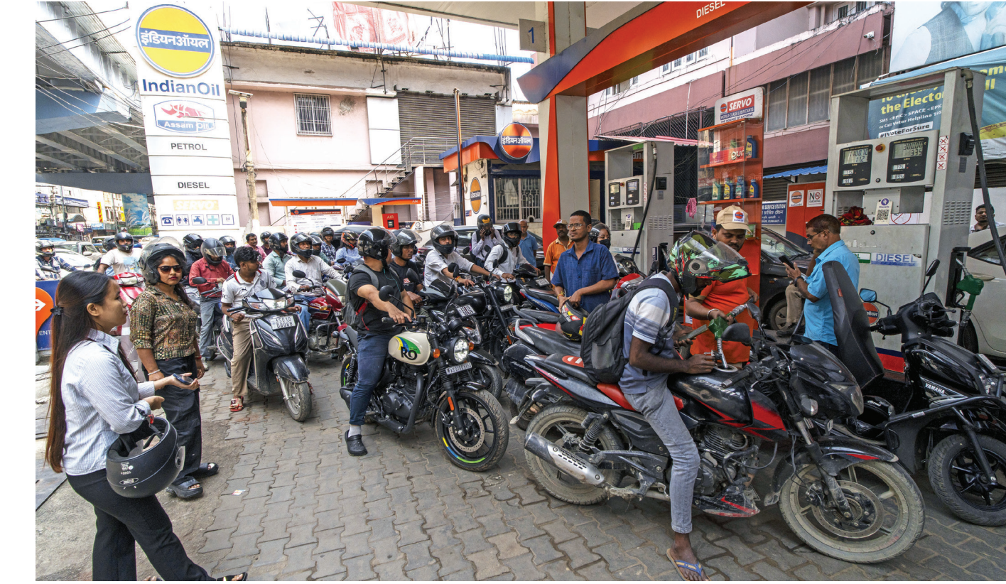
गुवाहाटी में अपने वाहनों में ईंधन भरवाने के लिए जुटे लोग

यह तीसरा तर्क सबसे ज्यादा पेचीदा, बल्कि सबसे ज्यादा बेईमान है। भाजपा मोदी सरकार के कार्यकाल में 50 लाख करोड़ रुपये से ज्यादा के 'डायरेक्ट बेंचिफिट