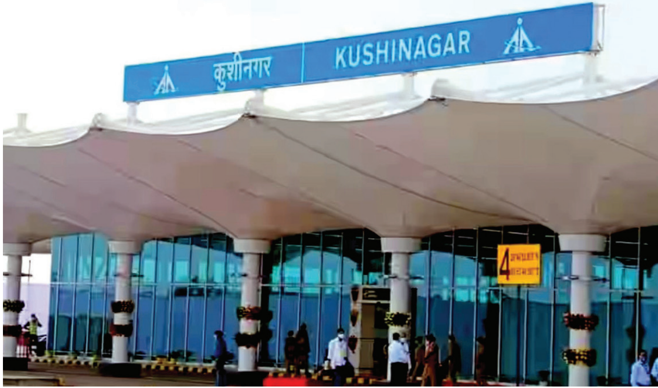
उत्तर प्रदेश का बहुप्रचारित कुशीनगर एयरपोर्ट जिते दो साल में ही बंद कर दिया गया

इन हवाई अड्डों का वास्तविक हाल किसी को भी जानना चाहिए। उत्तर प्रदेश में 7 नए एयरपोर्ट शुरू हुए, जिनमें से 6 अब बंद हैं। 2021 में पूर्वी उत्तर