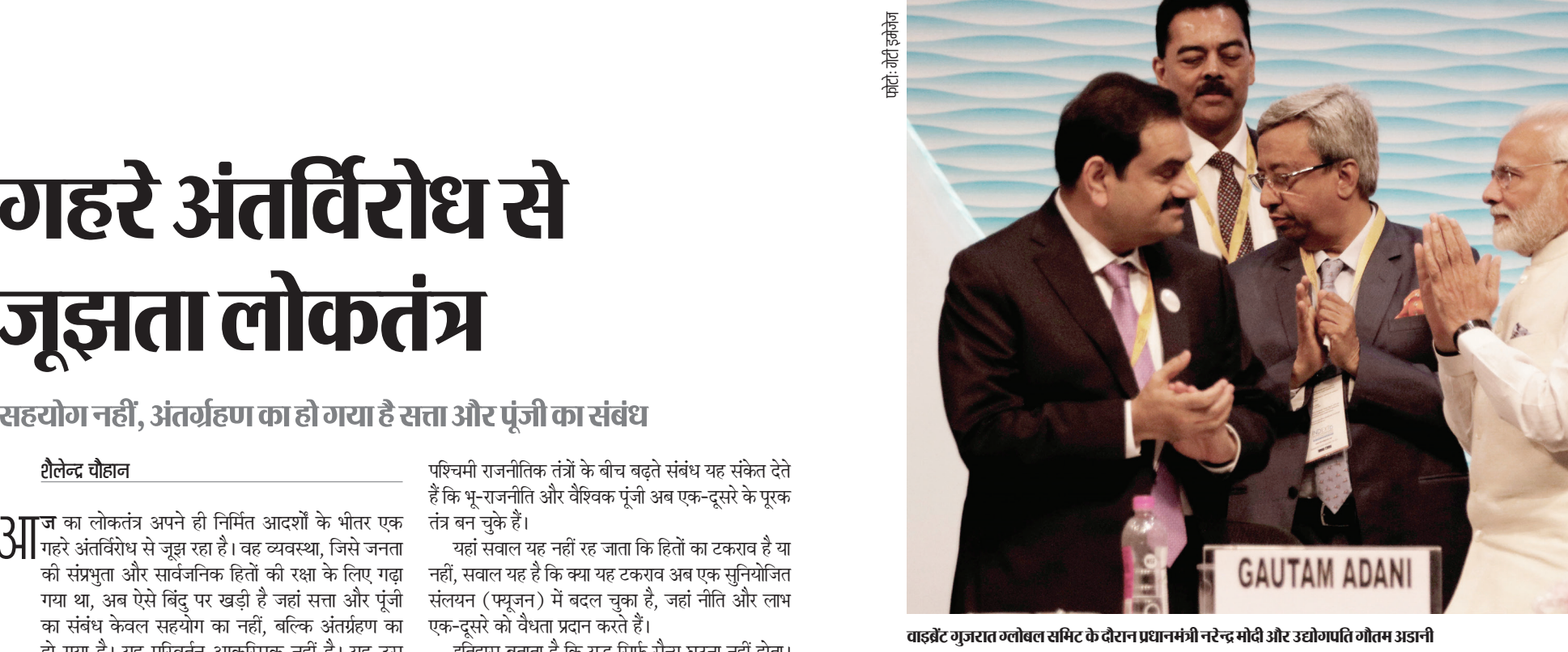
वाइब्रेंट गुजरात ग्लोबल समिट के दौरान प्रधानमंत्री नरेन्द्र मोदी और उद्योगपति गौतम अडानी