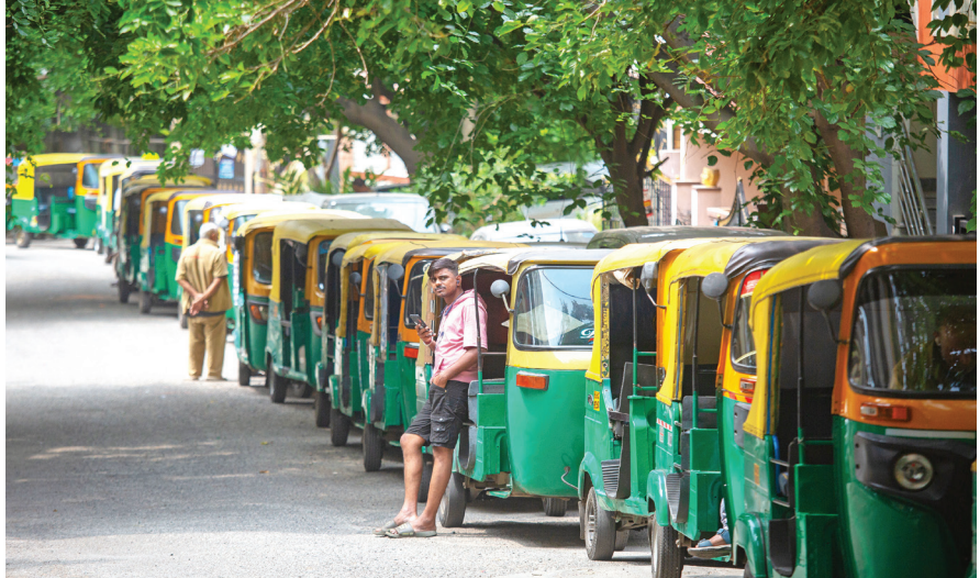
सरकार के पर्याप्त ईंधन भंडार के दावों को झुलताती पेट्रोल पंप पर लगी कतार

एक और अवलोकन यह है कि अमेरिका ने ईरान पर हमला किया है, जबकि उसकी कांग्रेस—यानी वहां की संसद—ने युद्ध की घोषणा नहीं की है। यह बात क्यों महत्वपूर्ण है? जब अमेरिकी संविधान पर बहस चल रही थी, तो उसके संस्थापकों का मानना था कि किसी एक व्यक्ति द्वारा युद्ध की घोषणा करने की क्षमता ही एक राजा को एक चुने हुए नेता से अलग करती है। राष्ट्रपति हिंसा को निर्देशित और प्रबंधित तो कर सकते थे, लेकिन औपचारिक घोषणा के बाद ही; युद्ध की घोषणा करने की जिम्मेदारी उठाने का काम कांग्रेस या संसद का था। ईरान युद्ध के दौरान शक्तियों के इस महत्वपूर्ण विभाजन का काफी नुकसान हुआ है, और यदि किसी देश पर आक्रमण करने की