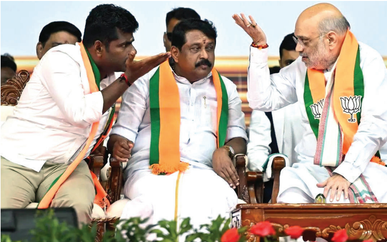
तमिलनाडु के पुदुकोट्टई में एक कार्यक्रम के दौरान अन्नाद्रमुक नेताओं के साथ केन्द्रीय गृह मंत्री अभित शाह

अन्नाद्रमुक के लिए यह दुविधा खड़ी करता है। विधानसभा चुनावों से पहले भाजपा के नेतृत्व वाले गठबंधन में उसकी वापसी 2024 के लोकसभा चुनावों में खराब प्रदर्शन की वजह से हुई। हालांकि, इस गठबंधन ने पार्टी की एक स्पष्ट वैचारिक स्थिति बताने की क्षमता को मुश्किल बना दिया है - खासकर धर्मनिरपेक्षता और सामाजिक न्याय