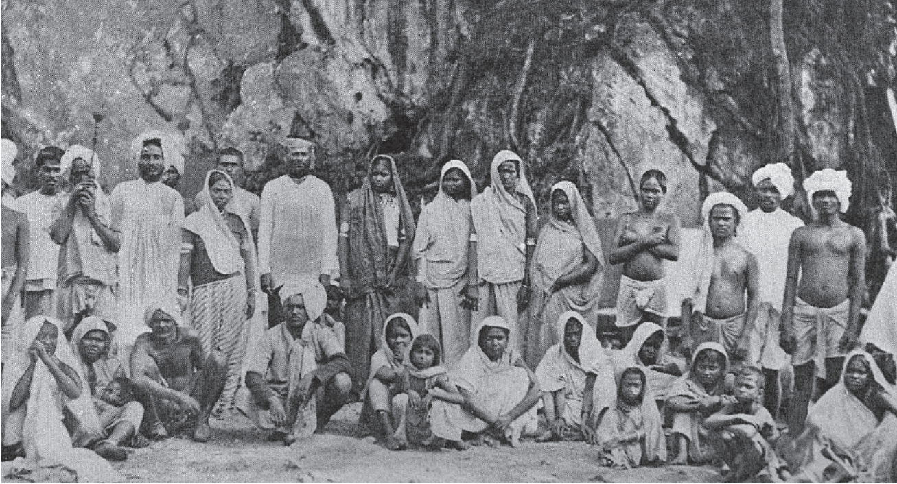
काम की तलाश में'भारत से विदेश जाने वाले गिरमिटिया मजदूर जिन्होंने मुक्ति के लिए लंबा संघर्ष किया

इस सिलसिले में अच्छी बात यह थी कि यह हिस्सा बहुत कुछ शेलकर भी अपनी संतानों को भरपूर शिक्षा दिलाता था, ताकि उनको उसकी जितनी विषम परिस्थितियों का सामना