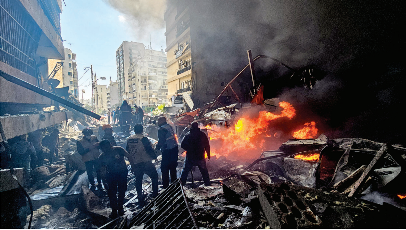
बेरूत के कॉर्निश अल-मज़ार इलाके में इसराइली हवाई हमले की जगह पर मलबे के बीच वचावकर्मि

इसराइल अपने इरादों को छिपा भी नहीं रहा। उसका मकसद अब सिर्फ हिज्जुल्लाह को कमजोर करना या उसके हथियार छीनना नहीं रह गया है, बल्कि लिटानी नदी तक बफर जोन बनाना और विस्थापित लेबनानी नागरिकों को दक्षिण में उनके घरों में लौटने से रोकना है। इस रणनीति के तहत सीमा पर बसे पूरे-के-पूरे गांवों को तबाह करने की योजना है। असल में, लेबनान में एक और जातीय सफाये