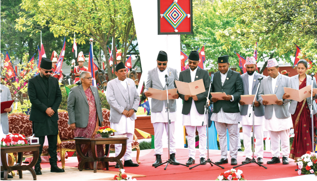
नेपाल के प्रधानमंत्री पद की शपथ लेते काठमांडू के पूर्व मेयर बालेन्द्र शाह जिनके समक्ष कम नहीं हैं चुनौतियां

प्रधानमंत्री बालेन्द्र शाह के सामने संतुलन साधने की चुनौती है। उन्हें प्रभावशाली ‘खस-आर्य’ जातीय समूहों और मधेसी, दलित तथा हाशिये पर पड़े अन्य समूहों के परस्पर विरोधी दबावों के बीच संतुलन बनाना होगा