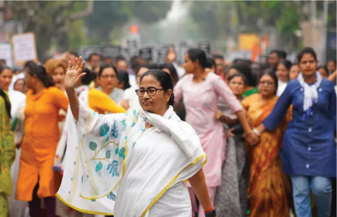
विवादस्पद एसआईआर और काफी नाम कटने के बावजूद कविलेगौर लगता है ममता बनर्जी के प्रति महिलाओं का रुझान

कई महिलाओं ने भते का इस्तेमाल पोल्ट्री फार्म शुरू करने, सिलाई मशीन खरीदने या छोटी-मोटी किराने की दुकानें खोलने के लिए किया है। ये भते तुरंत मुश्किलें तो खत्म नहीं करते, लेकिन योजना बनाने और बचत करने का मौका जरूर देते हैं