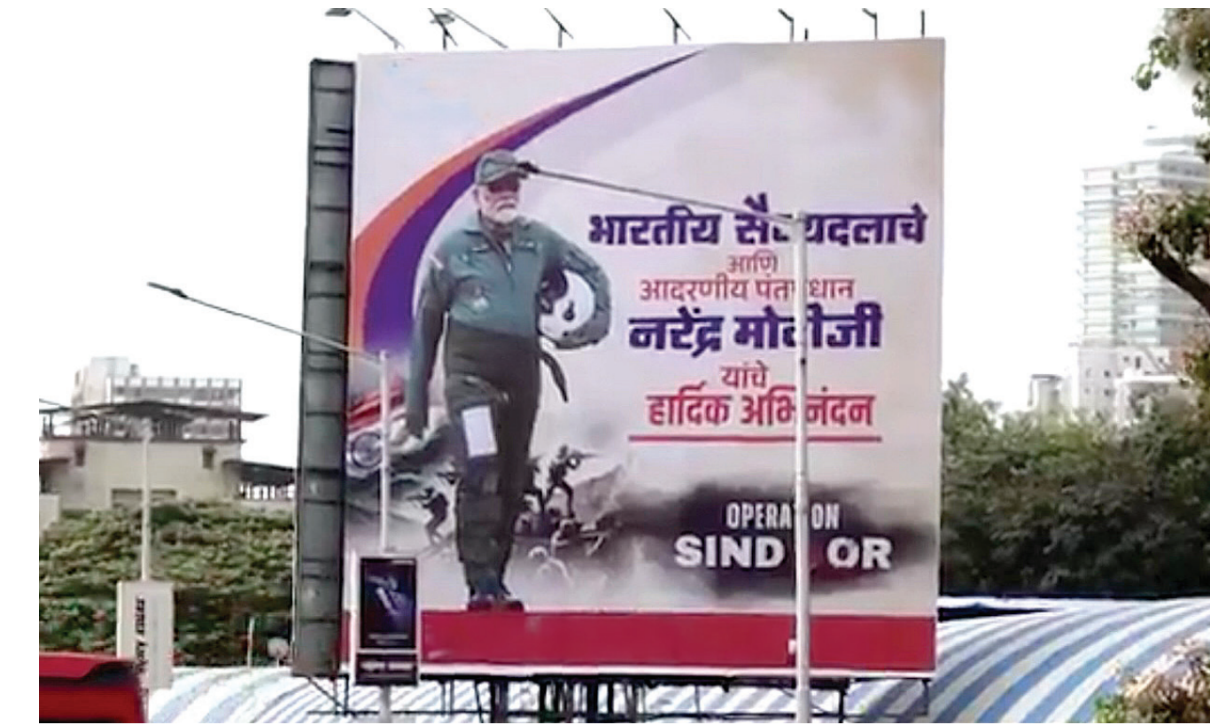
ऑपरेशन सिंदूर को लेकर सतारूढ़ दलों का फुलाया गुब्बारा अंततः फूट ही गया और राजनयिक फायदा अन्य देश उठा ले गए

पारंपरिक सैन्य श्रेष्ठता महज नारा नहीं। इसे सेंसर, मिसाइलों, इलेक्ट्रॉनिक युद्ध, कर्मांड नेटवर्क, लड़ाकू विमानों की गुणवत्ता, पायलट प्रशिक्षण और सूचना अनुशासन-इन सभी क्षेत्रों में साबित करना होगा। हो सकता है भारत ने संघर्ष के अंतिम चरणों में पाकिस्तानी हवाई अड्डों और सैन्य बुनियादी ढांचे पर हमले किए हों। संभव है, शुरुआती नुकसान के बाद उसने रणनीति बदलकर लंबी दूरी के सटीक हथियारों का इस्तेमाल किया हो। लेकिन आधुनिक युद्ध में, पहली तस्वीरें और शुरुआती दावे ही वैश्विक कहानो को आकार देते हैं। भारत की चुप्पी से पैदा खालीपन को पाकिस्तान ने भर और चीन ने उसे फैलाया। दुनिया ने भारत के घोषित ‘दंडात्मक और सटीक’ हमलों पर नहीं, बल्कि इसपर ध्यान दिया कि चीनी लड़ाकू विमानों और पाकिस्तानी रणनीतियों ने भारत की वायु शक्ति को सफल चुनौती दी। पाकिस्तान को अपने दावे को साबित करने की जरूरत नहीं थी। उसे बस भारत की हवाई ताकत पर शक पैदा करना था। इसलिए, ‘ऑपरेशन सिंदूर’ ने ऐसी कोई एकतरफा बढ़त हासिल नहीं की, जैसा भगवा समर्थक दावा करते हैं। भारत फौजी तौर पर ज्यादा