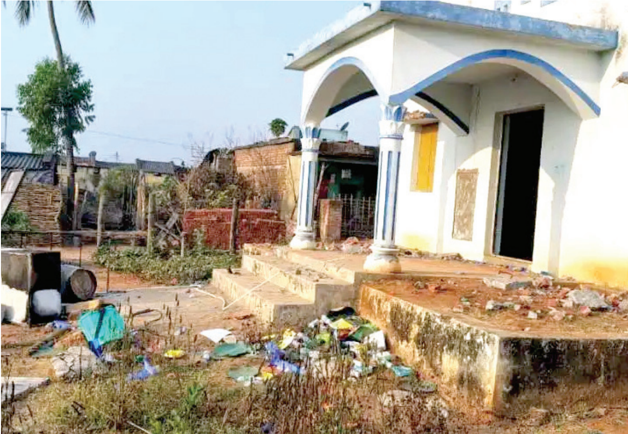
ओडिशा के रायगढ़ जिले के डेंगास्वर्गौ गांव का सेंट पॉल चर्च जिसे क्षतिग्रस्त कर दिया गया

आर्थिक बहिष्कार से लेकर शारीरिक हमलों तक, राज्य में ईसाइयों के खिलाफ तेजी से बढ़ती हिंसा सुनियोजित