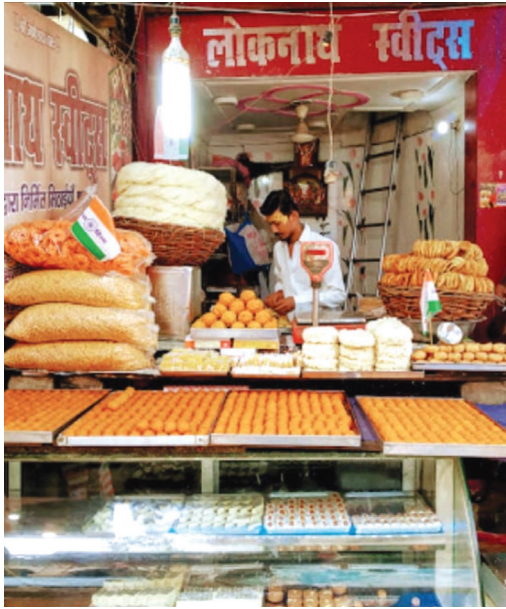
प्रयागराज में लोकनाथ की मिठाइयाँ और हरी राम एंड सन्स के समोसे का जवाब नहीं