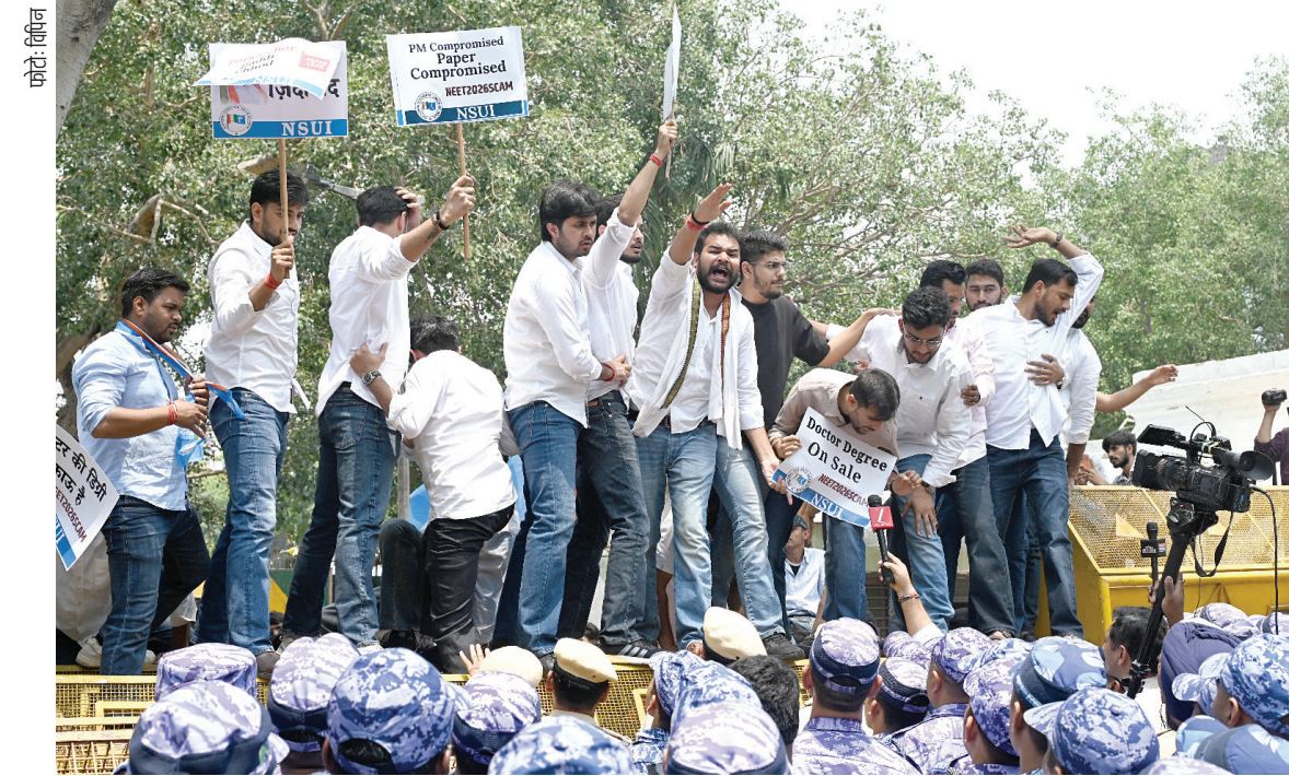
नीट का पेपर लीक होने पर नई दिल्ली में प्रदर्शन करते एनएसयूआई के कार्यकर्ता