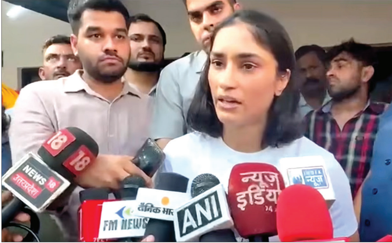
सीनियर ओपन रैंकिंग चैंपियनशिप में हिस्सा लेने से रोकने के फैसले पर अपना पक्ष रखती पूर्व ओलिंपियन विनेश फोगाट

भारतीय कुश्ती महासंघ के अध्यक्ष संजय सिंह ने 11 मई को गोंडा में यह घोषणा करते हुए कि "नियम किसी के लिए भी नहीं तोड़े जा सकते", पूर्व ओलिंपियन विनेश फोगाट की सीनियर ओपन रैंकिंग चैंपियनशिप में हिस्सा लेने की गुहार खारिज कर दी।