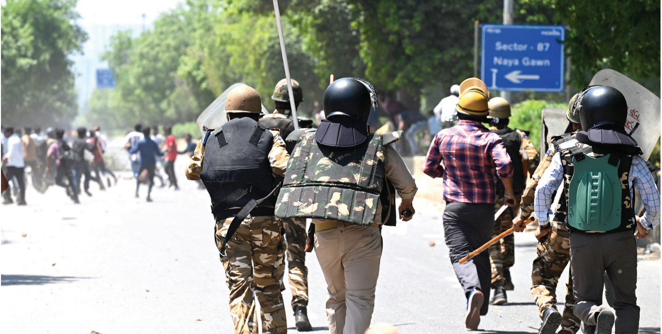
नोएडा इंडस्ट्रियल एरिया में सैलीटी बहाने की मांग को लेकर मजदूरों के आंदोलन के दौरान पुलिस ने लाठियां बरसाईं

कार्यपालिका ने हमारे समाज को इस हद तक क्रूर बना दिया है कि शीर्ष 10 फीसद लोग केवल अपनी सुख-सुविधाओं और विशेषाधिकारों की परवाह करते हैं, जबकि बाकी 90 फीसद लोगों को जैसे-तैसे गुजारा करने के लिए छोड़ दिया गया है